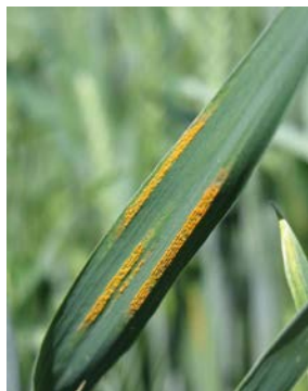
atac de rugina galbena