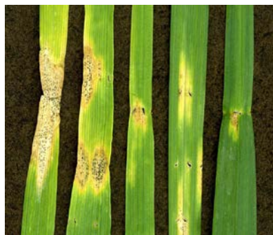
atac de septorioza