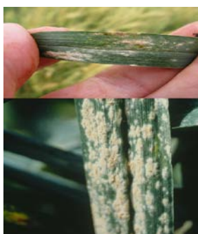
atac de fainare

Se recomanda executarea tratamentului fitosanitar la cereale pentru combaterea complexului de boli foliare: fainarea ( Erysiphe graminis ) , septorioza ( Septoria spp. ) , rugina ( Puccinia spp. ) , helminthosporioza ( Helminthosporium spp. ) .