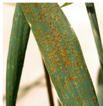
atac de rugina bruna